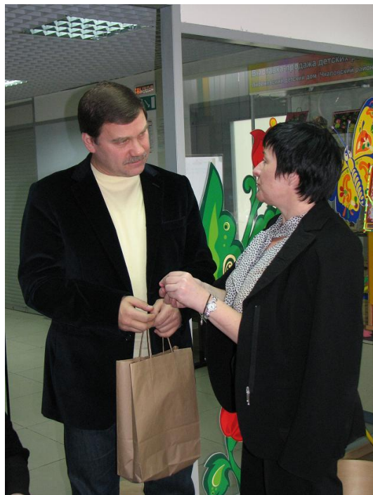
И.Б. Кондратьев на благотворительной встрече с представителями Польши

проходящих лечение в онкологических отделениях нижегородских больниц. Для многих больных донорская кровь – единственный шанс на спасение.