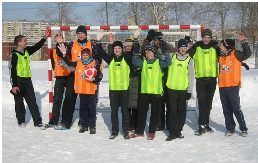
Воспитанники детского дома №1 на обновленном футбольном поле