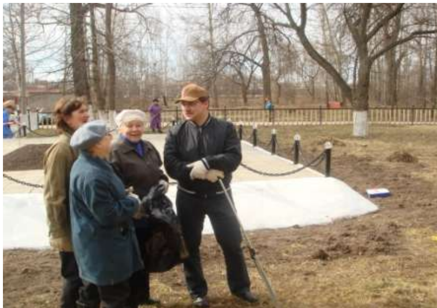
На субботнике с активистами микрорайона «15 квартал»

Всего с октября 2008г. по октябрь 2009г. была оказана благотворительная помощь на сумму 1 млн. 285 400 рублей.