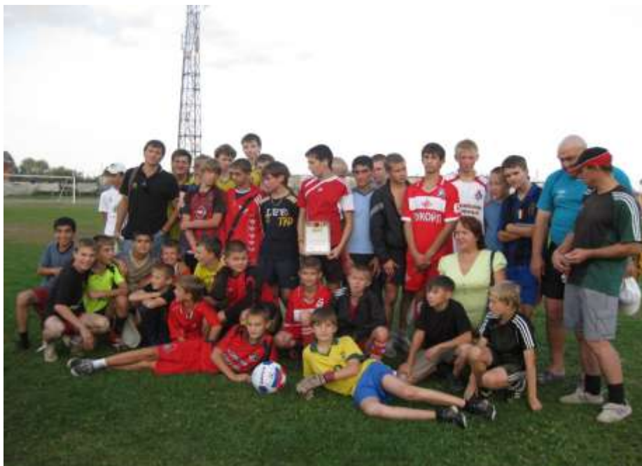
Участники турнира по мини-футболу среди дворовых команд микрорайона «Сортировочный» на кубок депутата городской Думы И.Б.Кондратьева