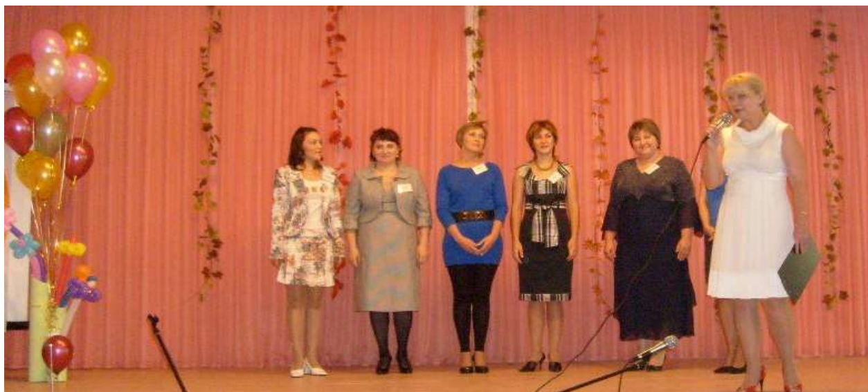
Участницы районного конкурса воспитателей «Солнце на ладони»